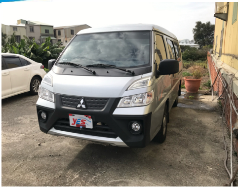
正面或左前側(含車頭)