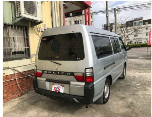
後面或右後側(含車尾)